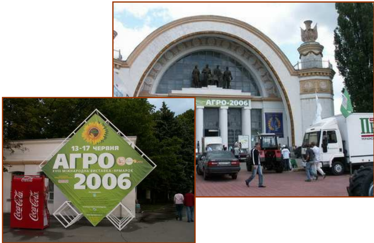
Im Eingangsbereich des Messegeländes wurden weitere ca. 500 Einladungsflyer verteilt.