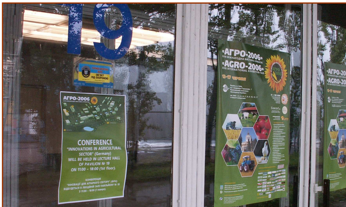
Auf dem Messegelände selbst wurde zusätzlich eine Plakataktion mit ca. 30 Plakaten im Eingangsbereich der Messehallen organisiert.